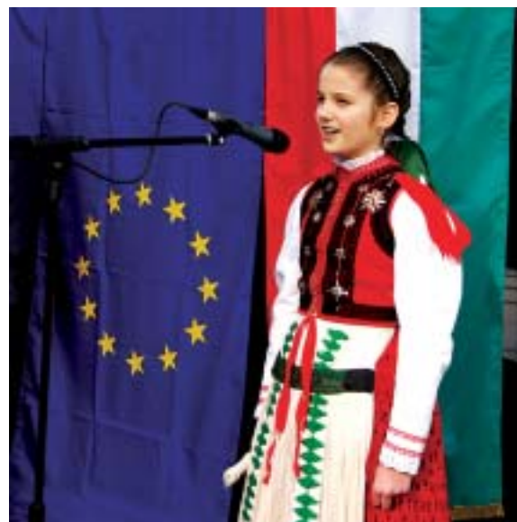
Erzsébetváros önkormányzatának március 15-i megemlékező ünnepségéről az 5. oldalon olvasható beszámolóink