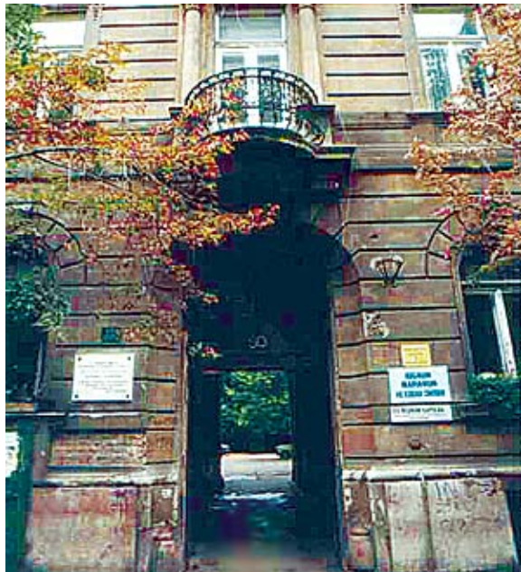
A Kis Regnum Kápolna bejárata a Damjanich utcában

hetséges. Köszönjük mindazoknak, akik a felhívásunkra a kidobandó, megsemmisítendő könyveket elhozták a kápolnába. Eljuttattuk őket a rászorulóknak. A kukába vagy a kályhába szánt szépirodalmi műveket, úti- és szakkönyveket, ifjúsági és gyermekirodalmat, képzőművészeti albumokat változatlanul átvesszük, kidobásuk, elégetésük bűn. Amennyiben valaki kora vagy betegsége miatt nem tudja elhozni őket, a 06-70-