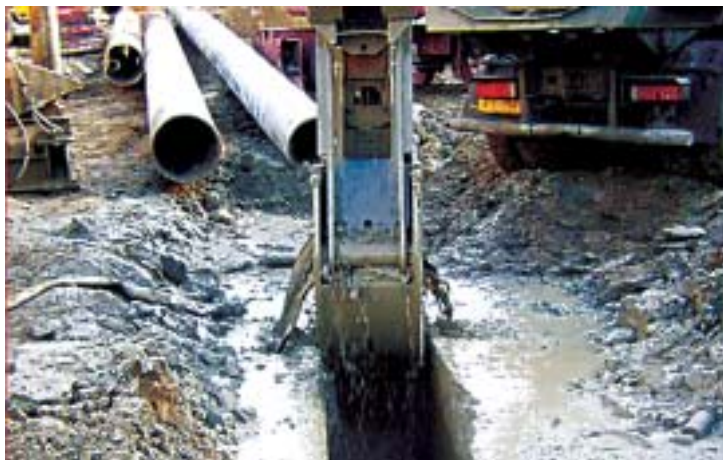
Egy óriási lánctalpas gép egy 23 méteres résfalat és a kijárat vasbeton szerkezetének

Előző lapszámunkban megírtuk, hogy március 6-án lezárták a Baross tér Keleti pályaudvar előtti részét, mert új aluljárót és kijáratot építenek a 4-es metróhoz. A lezárással kapcsolatos forgalmi rend változásról - ismerte a fővárosiak autózási szokásait - úgy véltük, hogy komoly fennakadásokat fog okozni a Baross tér környékén. Nos, sokunk nagy meglepetésére, nem lett káoszszerű és dugókkal színesített a tér és a Rákóczi út forgalma. Ennek oka lehet, hogy a fővárosiak részletes információkhoz jutottak a forgalmi rend változásról, és az is, hogy sokan messze elkerülik ezt a környéket. Remélhetőleg a júniusi átadásig nem is változik a forgalmi helyzet a Keleti környékén. Az építkezéssel kapcsolatos részleteket a www.metro4.hu honlapon található adatok alapján röviden összefoglaltuk.