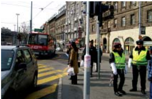
A Baross tér környékén rendőrök segítik a fennakadás nélküli forgalmat

Baross tér környékén. Nos, sokunk nagy meglepetésére, nem lett káoszszerű és dugókkal színesített a tér és a Rákóczi út forgalma. Most a 4-es metró építésével kapcsolatos munkálatokról tájékoztatjuk olvasóinkat az 5. oldalon.